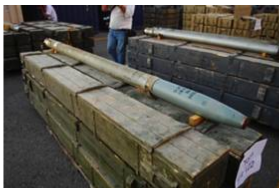
De Francop en zijn lading

De lading wapens was in de Egyptische havenplaats Damietta overgeladen van een schip dat voer onder de vlag van de Islamic Republic of Iran Shipping Lines (IRISL) op de 'Francop'. De Iraanse rederij staat op de zwarte lijst van de VN-veiligheidsraad zoals is vastgelegd in resolutie 1803. Deze resolutie vraagt aan landen waar de schepen van deze rederij aanmeren, deze te controleren. Het Iraanse schip was vertrokken uit de Iraanse havenstad Bandar Abbas en werd voor het eerst door de Amerikanen gespot in de Golf van Aden. Deze informeerden Israël dat vervolgens voorstelde het schip in de Rode zee te bombarderen, maar dat werd door de Amerikanen afgewezen. Iran probeerde de geheime diensten van het westen te misleiden door de lading in de Egyptische haven over te laden. Egypte deed geen enkele moeite de lading te controleren omdat, zo werd