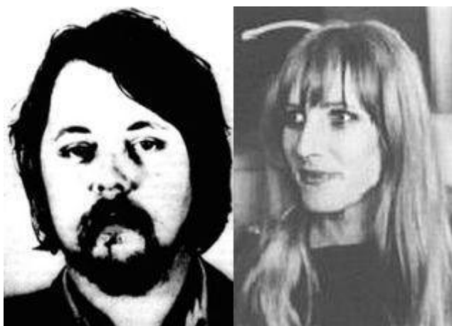
De Duitse kapers Wilfried Böse en Brigitte Kuhlmann

De Mossad besloot tot actie over te gaan nadat de terroristen dreigden de Joodse passagiers te zullen vermoorden wanneer hun eisen niet zouden worden ingewilligd. In het plan werd rekening gehouden met de mogelijkheid van een treffen met Oegandese troepen. Israëlische transportvliegtuigen brachten vervolgens 100 leden van een speciale elite-eenheid van het Israëlische leger over een afstand van 4000 kilometer naar Oeganda. In de nacht van 3 op 4 juli 1976 gingen ze tot de aanval over en wisten ze de gijzelaars te bevrijden die onder een kogelregen in de vliegtuigen werden geladen en via Nairobi naar Israël gevlogen. De hele operatie duurde circa 90 minuten. Bij de actie vielen in totaal 56 doden waaronder 45 Oegandese militairen, de acht terroristen waaronder Wilfried Böse en zijn vriendin Brigitte Kuhlmann en drie gijzelaars.