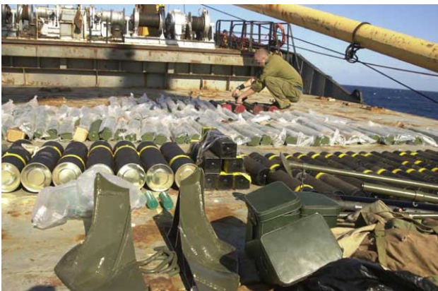
Lading Karina A

In de vroege ochtend van donderdag 3 januari 2002 enterde een groep commando's van de Israëlische marine tijdens een spectaculaire operatie in de Rode zee het schip de "Karina A ". Het schip was met 50 ton militaire uitrusting waaronder 2500 Katjoesja-raketten met verschillende reikwijdte, inclusief lanceerinrichtingen mortiergranaten, antitankraketten, geweren etc. onderweg naar Gaza toen het door Israël werd geënterd. PLO-terreurbas Jasser Arafat had voorafgaand aan deze gebeurtenis een geheime overeenkomst met Iran gesloten over een militaire basis in Gaza, Samaria en Judea. Iran zou in ruil hiervoor, Arafat een grote hoeveelheid wapens leveren.