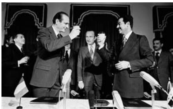
Jacques Chirac en Saddam Hoessein toosten op het gesloten contract

atoomwapens en gaf de opdracht de centrale met een precisiebombardement te verwoesten. Begin sprak van een “defensieve actie” omdat Israël door de plannen van Saddam Hoessein gedwongen werd actie te ondernemen. In een verklaring in het officiële orgaan van de Iraakse Baath-partij in 1980 werd duidelijk dat de Osirak reactor bestemd was om tegen, wat men noemde, de zionistische vijand op te treden.