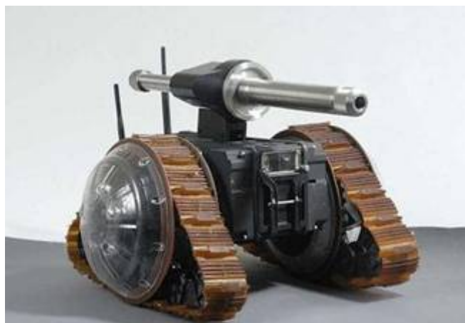
The Skylark Drone

Naast de bijzondere prestaties op militair gebied is Israël ook wereldleider op het gebied van innovatie betreffende militaire technologieën. Dat blijkt onder meer uit een drietal futuristische middelen die het Israëlische leger ter beschikking heeft. De informatie is ter beschikking gesteld door Israel Defense Forces . Het gaat om een VIPER Combat Drone, een EyeDrive en een Skylark Drone. De VIPER Combat Drone (adder; giftige slang) is een draagbare, lichtgewicht robot, speciaal ontworpen voor stedelijke oorlogvoering. De Drone heeft een speciaal wielsysteem dat van vorm kan veranderen. Het kan trappen beklimmen, door rotsachtig terrein rijden en door hele kleine ruimten kruipen. De robot is uitgerust met dag-en-nachtcamera's, microfoons, een GPS-systeem en een reeks sensoren die chemische producten, gassen, explosieven en straling kunnen ontdekken. De robot kan ook uitgerust worden met een mechanische arm, een mini UZI kanon en zelfs een granaat lanceerder.