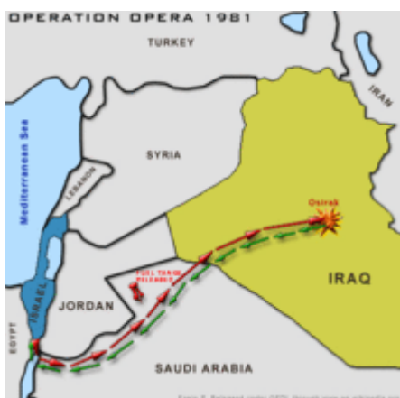
De vliegroute van de Israëlische vliegtuigen.

Acht F-16 jachtbommenwerpers en zes F-15 escortevliegtuigen van de Israëlische luchtmacht (IAF) vertrokken vanaf de luchtmachtbasis Etzion in de Sinaïwoestijn voor een vlucht van 1100 kilometer naar de Osirak reactor via de luchtruimen van Jordanië, Saoedi-Arabië en Irak. Om de Saoedi's te misleiden deden de piloten zich voor als Jordaniërs, onder meer door hun onderling radiocontact in het Arabisch te voeren. Bovendien vlogen ze op een hoogte van circa 240 meter boven de woestijn waardoor de kans groot was niet opgemerkt te worden door de grondstations en door Amerikaanse AWACS-toestellen die boven Saoedisch grondgebied patrouilleerden.