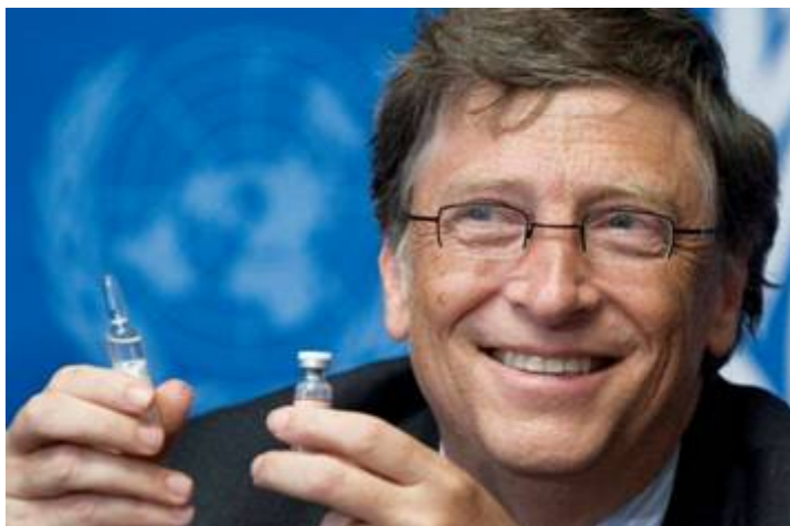
Bill Gates met één van zijn favoriete voorwerpen in zijn hand

Vanaf 2018 kreeg Kaag een rol in de samenwerking tussen de World Bank en de WHO de Global Preparedness Monitoring Board (GPMB) , een tak van de Wereldgezondheidsorganisatie (WHO) die zich bezighoudt met pandemieën en uitbraken. Als lid van deze club was Kaag medeverantwoordelijk voor de uitvoering van het GPMB-protocol in Nederland, terwijl zij tegelijkertijd directielid is van een panel dat ditzelfde protocol heeft samengesteld én dat toezicht houdt op de mondiale uitvoering. Door het GPMB wordt een beleid opgelegd die geen enkele rekenschap aflegt aan een land. Beleid dat ook nog tegen alle voortschrijdende inzichten in met starheid wordt uitgevoerd. Het GPMB orgaan schreef in april 2019 dat de wereld onvoldoende voorbereid is op een pandemie. Nog geen jaar later brak er een pandemie uit. Reeds in 2018 zat Kaag aan tafel zat de vaccin messias Bill Gates.