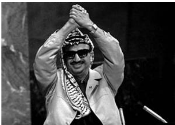
Arafat bij de Verenigde Naties.

3210 XXIX de PLO uit in de VN als zijnde de wettige vertegenwoordiger van het ‘Palestijnse’ volk. Nauwelijks een maand later, 13 november 1974, sprak PLO-leider Yasser Arafat de Verenigde Naties toe. Hij droeg tijdens zijn toespraak in de VN een olijftak ( om het theater te completeren ).