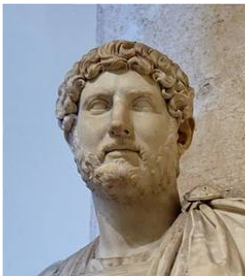
Keizer Hadrianus.

Deze vesting viel door verraad waarbij Bar Kochba sneuvelde met duizenden van zijn volgelingen. In totaal verloren 580.000 Joden het leven bij deze strijd en daar kwamen nog bij, al degenen die omkwamen door honger en ziekte. Talloze anderen werden gedeporteerd of als slaven verkocht, Joodse religieuze en politieke leiders, waaronder Rabbi Akiva en zijn discipelen, werden geëxecuteerd. Volgens Flavius Josephus woonden er zeven miljoen Joden in Israël in het jaar 70 en volgens Dio Cassius (Grieks geschiedschrijver ca 155-235 n.Chr) minstens drie miljoen in 135 n.Chr.