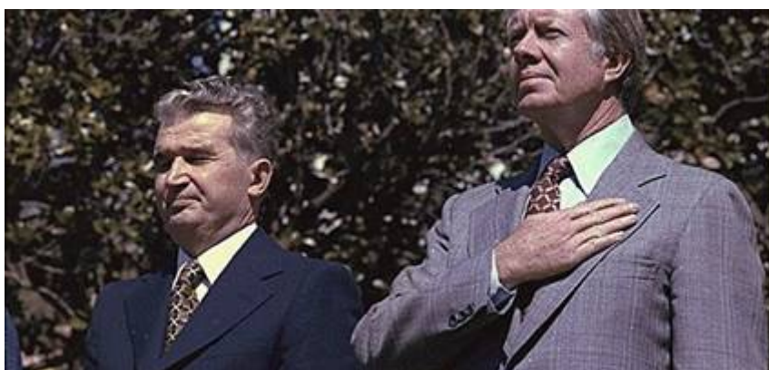
Nicolai Ceaucescu en Jimmy Carter

In de documentaire 'Disinformation: The Secret Strategy to Destroy the West' onthult Ion Mihai Pacepa, voormalig hoofd van de Roemeense militaire inlichtingendienst hoe de onbenullige Amerikaanse president Jimmy Carter destijds in de misleiding van de KGB is getrapt, door aartsterrorist Jasser Arafat als serieuze gesprekspartner voor vrede met Israël te accepteren. Toen Sovjetleider Leonid Breznev en KGB directeur Yuri Andropov hun pion Arafat naar voren schoven als 'vredesduif', riepen ze de hulp in van Amerika's favoriete tiran, de voormalige Roemeense dictator Nicolae Ceaucescu. Hij werd naar Washington gestuurd om president Jimmy Carter ervan te overtuigen dat Arafat een betrouwbare gesprekspartner was. Carter bekend geworden als één van de slechtste Amerikaanse presidenten ooit, hapte vervolgens in het lokaas. 'Ceaucescu overtuigde Carter dat hij Arafat zou kunnen overhalen om de PLO van een terreurorganisatie in een gezagsgetrouwe regering in ballingschap te veranderen.'