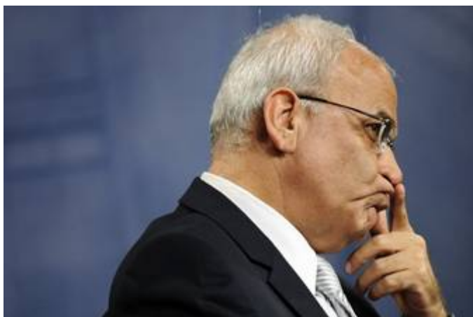
Serieleugenaar Saeb Erekat

Ook beweert Erekat dat het Palestijnse volk in 1948 met geweld uit hun huizen werden verdreven en verbannen uit hun thuisland. In 1948 bestonden er echter nog geen Palestijnen. Het ging om Arabieren die niet door Israël uit hun huizen zijn verdreven maar in opdracht van de Arabische leiders.