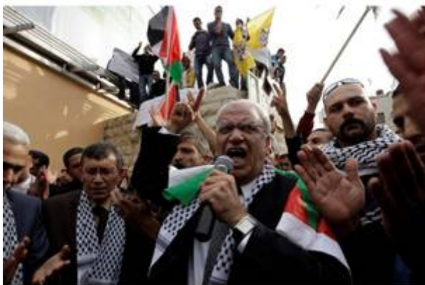
PLO- serie leugenaar Saeb Erekat

In een ander interview met Erekat in april 2002, claimde hij in een live interview op CNN dat Israëlische troepen schietend en schreeuwend Arafats compound in Ramallah waren binnengedrongen waarbij een politiemans om het leven gekomen was omdat de Israëlische militairen verboden hadden de man met een ambulance af te voeren. Gedurende het interview, schakelde CNN over naar een andere correspondent vlakbij Arafats compound om uit te zoeken wat er precies gaande was, maar deze zei dat er helemaal niets aan de hand was.