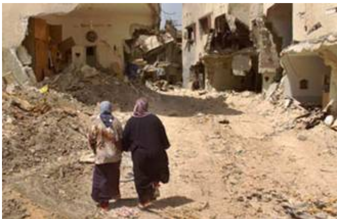
Mede door PLO- terroristen aangerichte verwoestingen.

Tijdens Israël's " Operation Defensive Shield " in de terreurstad Jenin in april 2002, vertelde hij aan de toegesnelde verslaggevers waaronder Bill Hemmer van CNN, dat Israël bezig was een massaslachting aan te richten onder de bewoners van het 'vluchtelingenkamp' in de stad. Saeb Erekat en Jasser Abed Rabbo vertelden dat er 1500 mensen werden vermist en er tenminste 500 lichamen onder het puin bedolven lagen. Ook spraken zij van openbare executies en dat het kamp helemaal met grond was gelijk gemaakt om zo de haat tegen Israël verder aan te wakkeren. De internationale media sprak zonder ook maar enige controle te hebben uitgevoerd, van een door Israëlische militairen aangerichte 'massamoord'. Een golf van verontwaardiging en anti-Israëlische hetze overspoelde de wereld. De toenmalige VN-gezant voor het Midden-Oosten Terje Roed Larsen , kwam zich persoonlijk op de hoogte stellen van de situatie en sprak eveneens van massamoord zonder de werkelijke feiten te kennen. Hij zei de lucht van rottend vlees te hebben geroken en speelde daarmee in op de internationale massahysterie rond de gebeurtenissen in het 'kamp'. Hij vertelde dat hij en zijn medewerkers gruwelen hadden gezien die het voorstellingsvermogen te boven ging.