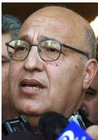
Leugenaar Nabil Sha'ath

geworden. Maar de uitspraak van Sha'ath dat was niets anders dan een flagrante leugen. Onderzoek wees uit dat er helemaal niets was veranderd. Een landkaart toonde ook toen nog steeds heel Israël van het uiterste noorden Metulla tot Eilat in het uiterste zuiden, met de aanduiding Palestina en werd het aloude Bijbelse land het hart van de Arabische natie genoemd. Het bestaansrecht van Israël werd ontkend en haat en geweld onverminderd gekweekt. Ook toen werd Israël voorgesteld als een bezettende macht en de kinderen geleerd dat het Meer van Galilea, Beerscheba en de Negev-woestijn tot 'Palestina' behoren, zodat zij zich zullen herinneren dat het om 'gestolen land' gaat.