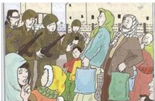
Illustration in Palestinian textbook

In examples, Jews demonized, martyrdom praised, Jewish Quarter removed from Old City map, Hebrew erased from Mandate-era stamp.