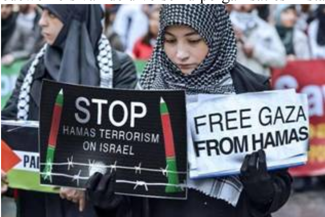
Moslimvrouwen in Gaza betogen tegen de dictatuur en vrouwenonderdrukking van Hamas in de Gazastrook

Oude Arabische vrouwen en kinderen worden door Hamas gedwongen om te blijven wonen in fake tentenkampen midden tussen de puinhopen om zo de Westerse journalisten en allerhande diplomaten te misleiden zodat Hamas kan laten zien hoe 'vreselijk' Israël met de bevolking in Gaza omgaat. Dat zorgt namelijk voor de constante toestroom van buitenlandse giften, en het houdt de banen van de honderden medewerkers van de diverse hulporganisaties in stand die met dit geld worden betaald.