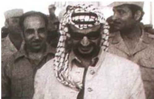
De door de wereldleiders indertijd zo geliefde terreurbaas Jasser Arafat.

Vanaf het moment dat Jasser Arafat de leiding kreeg over de Palestijnse Autoriteit (PA) de “Bende van Ramallah” was er voor de Palestijnse burgers geen enkele sprake meer van enige politieke vrijheid. De burgerrechten werden met voeten getreden en er heerste een constante atmosfeer van agressie en brutaliteit van de verschillende terreurbendes die onder Arafats leiding vielen. Meningsvrijheid werd niet getolereerd en bijeenkomsten van de oppositie verboden. Burgers die het niet eens waren met zijn beleid, liepen het risico al hun persoonlijke bezittingen kwijt te raken, geconfiscieerd door Arafats corrupte politieapparaat. Journalisten die niet schreven wat hun werd opgedragen of die het lef hadden Arafats wachtende vleiers en slippendragers te bekritisieren, werden opgesloten en gemarteld. Vanaf het moment dat Arafat gezag is gaan uitoefenen in Gaza, en delen van Samaria en Judea, is hij begonnen alle lokale critici van de pers te muilkorfen door middel van willekeurige arrestaties, bedreigingen en psychische intimidatie.