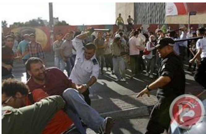
Grof geweld door PA-politie

Bij vreedzame demonstraties wordt dikwijls gebruik gemaakt van knuppels en geweerkolven en wordt de uitrusting van journalisten vernield. Er zijn gevallen bekend dat de armen van demonstranten op hun rug worden vastgebonden, en vervolgens omhoog worden getrokken totdat hun schouders uit de kom zijn. Bovendien vallen politieagenten in burger vrouwelijke demonstranten lastig en komt het tot seksuele overvallen. Hoe gewelddadig het er toe gaat mag ook blijken uit de manier waarop Mazens 'politiekorps' burgers in elkaar slaat , tijdens manifestaties tegen zijn bewind. Zelfs meisjes worden geslagen .