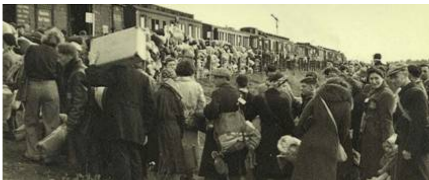
Op 3 september 1944 vertrok het laatste transport vanuit Westerbork naar Auschwitz

De Nederlandse Spoorwegen verdienden zelfs veel geld aan de transporten. Er werden duizenden wagons ingezet waar mensen als vee in werden geduwd, de NS heeft hier nooit tegen geprotesteerd. In twee jaar tijd vervoerden de NS 110.000 Joden naar het oosten van het land, de meesten naar kamp Westerbork, het doorvoerkamp van waaruit geïnterneerden naar Duitse concentratiekampen werden gebracht. Slechts een handjevol van hen kwam terug. Eind 1942 was het al lang bekend dat er zich vreselijke dingen afspeelden in de kampen.