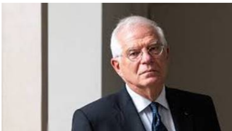
Joseph Borell Fontelles, EU-buitenlandchef.

Maar nu is er na de drie voorgaande anti-Israël activisten, Javier Solana , Catharine Ashton en Mogherini een volgende 'anti-Israël activist' een nitwit (hatelijke nietsnut) verschenen want de benoeming van Josep Borrell Fontelles belooft bij voorbaad al niet veel goeds voor Israël want hij staat bekend als een vriend van Iran en de "Bende van Ramallah". De slechte relatie tussen Israël en de Europese Unie onder Mogherini zal zich voortzetten onder Borrell .