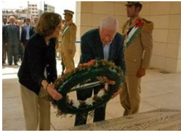
Rechts, Carter legt