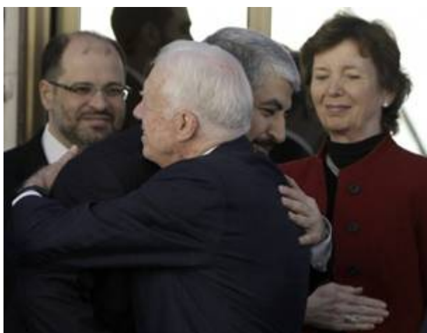
Hier wordt de terrorist Meshaal hartelijk omhelsd door zijn vriend Jimmy Carter met Mary Robinson rechts.

Carter zei er bij president Barack Hoessein Obama op te hebben aangedrongen Hamas, van de lijst van verboden terreurorganisaties te halen. Terwijl de humanitaire situatie in Gaza beter is dan in vele andere landen in het Midden-Oosten en Afrika, noemt Carter Gaza een 'ommuurd getto' waar 1,6 miljoen Arabieren onder zeer moeilijke omstandigheden leven. Bovendien zijn er in Gaza meer hulporganisaties werkzaam dan in tien Afrikaanse probleemlanden samen. In 2008 beweerde hij dat de inwoners van Gaza werden uitgehongerd tot de dood en in 2009 zei hij dat ze letterlijk sterven van de honger .