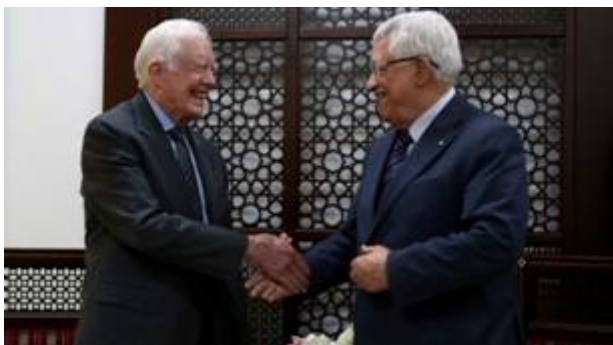
Ramallah, zaterdag 2 mei 2015. PLO-terreurleider Abu Mazen schudt hartelijk de handen van de Israël hatende pindaboer Jimmy Carter

Op zaterdag 2 mei 2015 was de Israël hatende pindaboer Jimmy Carter weer bij zijn terreurvrienden in Ramallah op bezoek . Carter was ook van plan om zijn vrienden van Hamas in Gaza te bezoeken maar dat ging om onduidelijke redenen niet door. Volgens Carter is "Hamas geen terreurorganisatie" maar een "gewone verzetsgroep" met wie kan en moet onderhandeld worden. Over Hamas terreurleider Khaled Meshaal zei hij: " Ik geloof niet dat hij een terrorist is. Hij is een sterke voorstander van het vredesproces. (klinkklare leugens) Meshaal heeft zijn interesse uitgesproken dat de Saoedi's een 'vredesontmoeting' zouden organiseren en dat de [in Doha Qatar gevestigde] Hamasleider het bestaansrecht van Israël wilde erkennen gebaseerd op het Arabische Vredes Initiatief van 2002. " Totale onzin wat Carter hier beweerd. Prachtig hoe zowel premier Netanjahoe als president Reuven Rivlin Carter op voorhand lieten weten hem niet te willen ontmoeten wegens zijn gekende "anti-Israël posities" en noemden Carter "een ramp voor Israël." Hij vertelde in een interview met Channel 2 dat hij inderdaad met Rivlin wilde spreken maar dat de Israëlische president zijn verzoek had afgewimpeld.