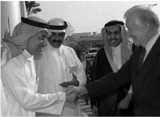
Carter op bezoek bij zijn Arabische donoren

In 1993 ontving hij van het Saoedische prinsengebroude 7.6 miljoen dollar en in 2005 nogmaals 5 miljoen. De familie van Osama bin Laden gaf hem in 2000 1 miljoen dollar. In 2001 was Carter in de Verenigde Arabische Emiraten (UAE). Daar ontving hij de Zayed Internationale prijs voor natuurbehoud, genoemd naar sjeik Zayed, een potentaat en levenslang president. Voor deze onderscheiding ontving Carter 500.000 dollar.