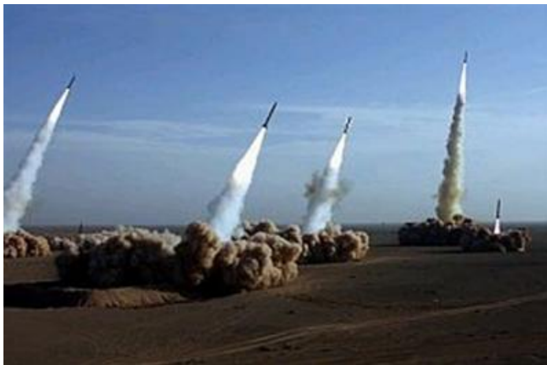
Iran test raketten.

Iran beschikt over ongeveer 500 ballistische raketten met een bereik van 1300 km. Deze zogeheten Shihab raketten hebben vanaf de lanceerinstallaties in Iran ongeveer tien minuten nodig om hun doelen in Israël te bereiken en kunnen bommen van 1000 kilo vervoeren. Shihab is het Perzische woord voor meteor. De raket is afgeleid van de Noord Koreaanse Nodong-1 raket en gemoderniseerd met Russische technologie. Tijdens de laatste militaire parade in Teheran trok een hele serie raketten aan het publiek voorbij waarvan sommige met het opschrift „Israël moet van de kaart verdwijnen” en „Wij zullen Israël verpletteren.“