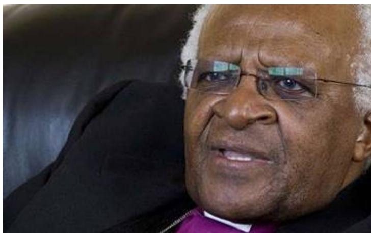
Desmond Tutu beschuldigd Israël van apartheid

Wat alle anti-Israël activisten beweren past niet in de omschrijving van een apartheidsstaat . Ook de Black Lives Matter coalitie (BLM) noemt Israël in haar programma een "Apartheidsstaat" en genocide op de Palestijnen zou plegen. Ze verkondigen zelfs oorlog tegen de Joodse staat te willen voeren. Figuren die Israël beschuldigen van "apartheid", zijn niets anders dan leugenaars en ordinaire Jodenhaters. Er zijn talloze voorbeelden dat Israël geen apartheidsstaat is.