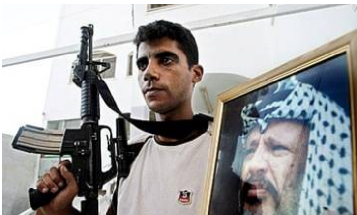
Zakaria Zubeidi met portret van Arafat

Israëlische Autoriteiten zijn doctoraal in politieke wetenschappen. Zubeidi is de voormalige chef van de Al-Aqsa Martelarenbrigades in de terreurstad Jenin. Hij wordt gezien als één van de " symbolen " van de door Jasser Arafat georkestreerde 2 e Intifada . In die periode hield hij toezicht op talrijke dodelijke aanslagen.