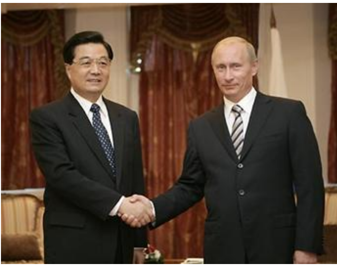
Hu Jintao , voormalig president van China van 2003 t/m 2013 en Vladimir Poetin.

Reeds in juli 2001 hebben de Russen met de Chinezen een strategisch partnerschap gesloten. De gesprekken op hoog niveau tussen China en Rusland geven aanleiding tot grote ongerustheid onder de Westerse experts. In de Verenigde Naties is het al goed te merken dat de Russen en de Chinezen elkaar de bal toespelen, en het steeds vaker roerend eens zijn. Russen en Chinezen hebben al diverse gezamenlijke legeroefeningen achter de rug en hebben in bedekte termen gewaarschuwd, dat zij atoomwapens zullen gebruiken tegen de Verenigde Staten wanneer zij vinden dat hun belangen in gevaar komen. Het doel van de samenwerking is ook eventuele