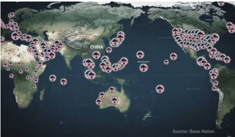
Amerikaanse militaire basis

China heeft Amerika gewaarschuwd dat het tot een oorlog zou kunnen komen indien de Verenigde Staten mocht besluiten Taiwan (het vroegere Formosa) te hulp te komen bij een aanval van China. Washington heeft namelijk toegezegd Taiwan militair te zullen bijstaan indien het mocht worden aangevallen. China heeft een wet aangenomen die de leiders van het land een legale basis biedt voor een aanval op Taiwan. China ziet dit eiland nog altijd als een deel van China. Het Chinese leger houdt met regelmaat militaire oefeningen in de straat van Taiwan, een zee-engte tussen China en Taiwan. De Chinese generaal-majoor Zhu Chenghu , hoofd van de Chinese Nationale Defensie Universiteit, baarde op 16 juli 2005 opzien, toen hij zei dat China kernwapens tegen Amerika zal gebruiken indien er een militair conflict met Taiwan mocht uitbreken.