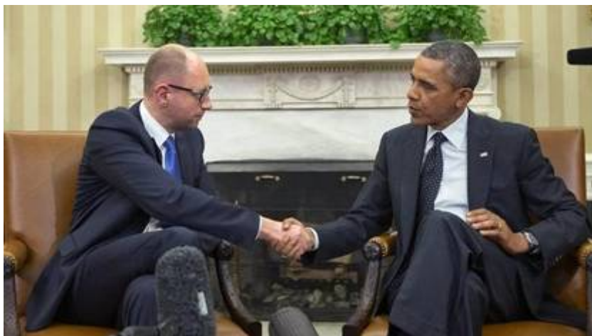
Areniy Yatsenyuk en zijn opdrachtgever

De zogenaamde 'revolutie' in Oekraïne is niets anders dan een door het Westen georganiseerde en door de NAVO gesteunde fascistische coup om het land te annexeren en binnen de Westerse invloedssfeer te brengen. Het begon allemaal met het door Washington geregisseerde omverwerpen van de democratisch gekozen regering en het vervangen daarvan door een stel geselecteerde lakeien. Eerst werd de ongekozen Areniy Yatsenyuk op de troon in Kiev gezet en direct door de leiders in Washington en Brussel erkend.