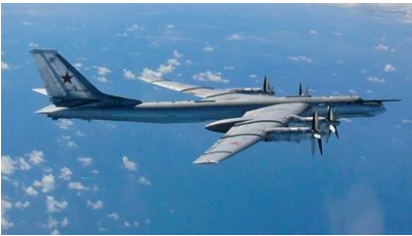
Russische nucleaire bommenwerper, bewapend met zes nucleaire kruisraketten.

gesignaleerd. Tussen 29 juli en 7 augustus 2014 werd het Amerikaanse luchtverdedigingssysteem maar liefst 16 keer door Russische nucleaire bommenwerpers en andere militaire vliegtuigen getest. Volgens militaire deskundigen zijn dit geen trainingmissies zoals in sommige kringen is gesuggereerd maar hebben ze te maken met de sterk bekoelde relatie tussen Moskou en Washington. Gedurende de Koude Oorlog vlogen Sovjet bommenwerpers het Amerikaanse luchtruim binnen als voorbereiding op een eventueel militair conflict.