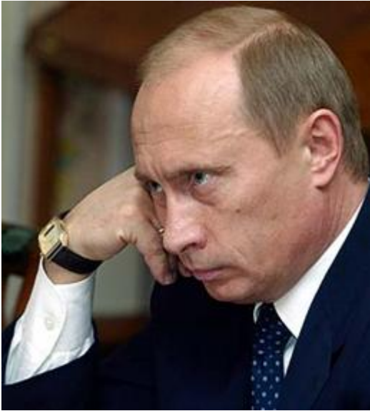
De in 1952 in Leningrad (later St.Petersburg) geboren Vladimir Vladimirovich Poetin.

De ster van Poetin schoot na het verdwijnen van de Jeltsin-kliek, als een komeet omhoog. In september 1999 bleek zijn populariteit na een opinieonderzoek slechts 2% te bedragen. Nauwelijks een paar maanden later werd hij tot president van Rusland gekozen. Omhooggeschoten van hoofd van de geheime politie naar de hoogste functie in Rusland. Om de chaos die de 'clandemocratie' van Boris Jeltsin had achtergelaten weer onder controle te krijgen wist hij met de sluwheid van een slang in korte tijd allerlei maatregelen en wetten door het parlement te jagen. Poetins belofte de bestuurlijke orde in Rusland te herstellen is door hem met voortvarendheid opgepakt. De macht die de regiogouverneurs van Jeltsin hadden gekregen, zijn volledig door hem aan banden gelegd en net als in het vroegere communistische en tsaristische tijdperk weer geheel door Moskou overgenomen.