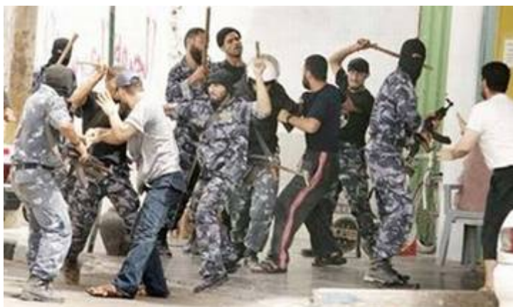
Moslimbroeders van Hamas en Fatah slaan elkaar in een 'vredezame' dialoog de hersens in.

In januari 2006 won Hamas de verkiezingen in de gebieden die onder controle staan van het bewind in Ramallah. In eerste instantie stond Gaza nog onder gezag van de PLO maar dat veranderde in 2007, toen Hamas een bloedige coup pleegde culminerend in een burgeroorlog. De onderlinge 'duscussie' liep enigszins uit de hand! Balans: 616 doden, waaronder 400 aanhangers van het corrupte bewind van Abu Mazen (Mahmoud Abbas). Daarnaast 1500 gewonden waarvan vele voor het leven verminkt en duizenden werden door leden van Hamas uit Gaza verdreven. Mazen maakte dat hij wegwam om ook niet vermoord te worden want wie niet tijdig kon vluchten werd achter de tralies gegooid en gemarteld of vermoord. Zij gaven zich over met al hun wapens die ze van de Amerikanen en Israël hadden gekregen. Egypte wilde ze niet. Israël was het enige land dat troepen, helikopters en ambulances stuurde opdat ze niet allemaal zouden worden afgeslacht. Islam tegen de islam.