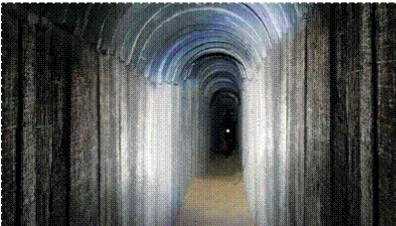
Een van de vele ontdekte tunnels.

Tijdens de oorlog "Operation Protective Edge" (Operatie Beschermende Rand) van 2014 tussen Israël en de terreurbeweging Hamas werd Israël geconfronteerd met aanvallen vanuit door Hamas aangelegde tunnelnetwerken. Deze tunnels vormden een enorme bedreiging voor de Israëlische militairen en burgers. Het Israëlische grondoffensief begon een uur nadat dertien zeer zwaar bewapende terroristen van Hamas probeerden via een tunnel een massamoord op burgers uit te voeren bij Kibboets Sufa, of burgers of militairen te ontvoeren. Het leger gaf beelden vrij hoe de terroristen de benen namen nadat ze werden betrapt en zich haastig terug in de tunnel probeerden te wurmen . Ze werden onder vuur genomen waarbij zeker acht van de 13 terroristen werden gedood. Rond de tunnelopening lag het vol met achtergelaten schiettuig en in de tunnel zelf werden onder meer RPG raketten, explosieven, boobytraps, radio's en mini bunkers aangetroffen. De betrokken tunnel werd weggebombardeerd evenals 34 nadien ontdekte tunnels . Deze tunnels lopen honderden meters diep Israël in en vormen een directe bedreiging voor de omliggende Israëlische dorpen. Minstens 160 kinderen uit Gaza zijn gedood tijdens het graven van deze tunnels.