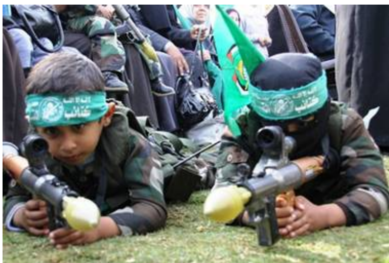
De Hamas “Moloch cultus” in actie.

Steeds opnieuw gaat de leugenwinkel van Pallywood gewoon verder met haar sloopwerk van de waarheid. Zo was het in 2009, 2012, 2014 en zo zal het ook bij een volgende oorlog weer zijn. Elke dode in Gaza moet en zal een slachtoffer zijn van de Zionistische bezetter en gezien de ervaring zal de mainstream media dat allemaal weer met genoegen overnemen.