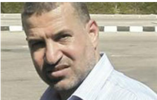
Topterrorist Ahmed Said Halil Jabari

Hamas gebruikte tijdens Operatie Piller of Defense op professionele en doordachte wijze de media om de publieke opinie op te zetten tegen Israël. Nieuwsagentschappen en nieuwsleveranciers maken zich medeplichtig aan deze mediafraude door gemanipuleerd beeldmateriaal te gebruiken om hun anti-Israël verhalen kunstmatig op te smukken. Nagenoeg alle Westerse mediakanalen en nieuwsleveranciers (AFP, CNN, Reuters, EPA enz.) komen op de proppen met pakkende foto's van ruïnes waarin speelgoed opduikt dat vrijwel nagelnieuw en ongeschonden uit de puinhopen werd opgedolven. Allemaal nep. Het speelgoed werd er door de fotografen zelf bijgelegd. De truuk werkt altijd. Zie wat er gebeurt wanneer er camera's verschijnen op de plaats van een aanval op Gaza en er simpelweg niet genoeg dode en gewonde Arabieren te zien zijn, dan maakt de leugenmachine weer overuren en organiseren ze gewoon wat. Dit voorbeeld werd uitgezonden tijdens een interview van de BBC naar aanleiding van de doelgerichte uitschakeling van Hamas topterrorist Ahmed Said Halil Jabari door het Israëliëse leger. In de videoclip is een Arabier te zien in beige jacket en zwarte T-shirt, die zo het lijkt gewond is geraakt tijdens de Israëliëse luchtaanval en door enkele mede omstanders wordt opgepakt en weggedragen. Nauwelijks drie minuten later is het 'slachtoffer', opmerkelijk snel hersteld, springlevend terug te zien.