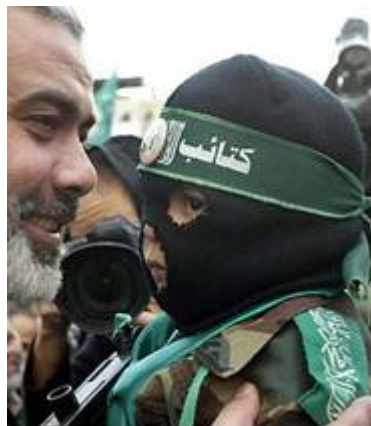
Links de Palestijnse

zomerkampen en rechts Hamas terreurleider Ismail Haniyeh met een van zijn kleine helden.