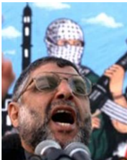
De op 17-04-2004 geliquideerde Abdel Aziz Rantisi

Wie die ongedeerde, langs de Middellandse Zee kuierende voetganger is, vertelt het bericht niet. Klik ook hier wat een geluk deze voetganger heeft.