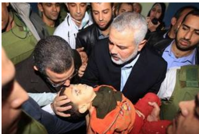
Hisham Kandil en Hamas terreurbaas Ismail Haniyeh