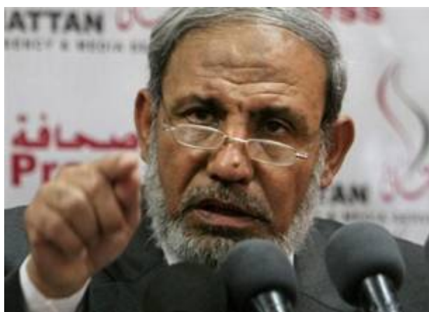
Rechts Hamas terrorist Mahmoud al Zahar