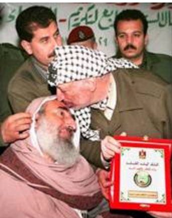
Hier wordt Ahmed Yassin gekust door aartsterrorist Jasser Arafat

Als 'geestelijke' predikte hij voor „de bevrijding van Palestina van de rivier de Jordaan tot de Middellandse zee.“ Hij leerde zijn gevolg dat de Joden afstammelingen zijn van apen en varkens. Hij heeft er nooit een geheim van gemaakt tegenstander te zijn van een Joodse staat in het Midden- Oosten. Vlak voor hij met een raket- afgevuurd door een IDF-helikopter, werd geliquideerd, zei hij nog in een interview met het Duitse blad Der Spiegel dat de Joden maar een eigen staat moeten zoeken in Europa. De leiders van Europa waren er als de kippen bij om de liquidatie te veroordelen en spraken van een "Buitenwettelijke moord". De Britse dwaalgeest van Buitenlandse zaken Jack Straw zei “de aanslag op de oude man van (80) in zijn invalidenwagentje onwettig, onacceptabel en ongerechtvaardigd te vinden.”