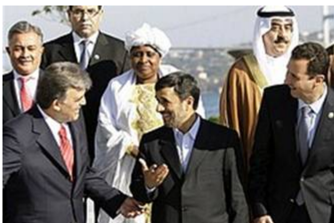
De Turkse president Adullah Gul op de voorgrond met de Iraanse demagoog Ahmadinejad en de Syrische dictator Bashar Assad tijdens de conferentie in Istanboel.

Assad waarschuwde Israël op 9 november 2009 dat wanneer de Joodse staat niet van plan is te onderhandelen over ‘teruggave’ van de Golan Hoogvlakte, zijn land zal terugkeren naar de status van geweld om op deze manier de hoogvlakte weer onder controle te krijgen. Sprekend op een islamitische conferentie in de Turkse hoofdstad Istanboel, zei Assad dat hij nog steeds hoopt op een vreedzame oplossing van het conflict met Israël, maar als de oplossing niet is gebaseerd op een volledige terugtrekking van de Golan, alle opties zullen worden overwogen. „ Verzet tegen de bezetting is een patriottische plicht en het ondersteunen ervan is een morele en wettelijke verplichting...en een eer waar we trots op zijn. ” Assad ging verder met te zeggen dat de werkelijke oorzaak van de problemen in regio „ de zionistische bezetting is en dat het tijd wordt deze te elimineren. ”