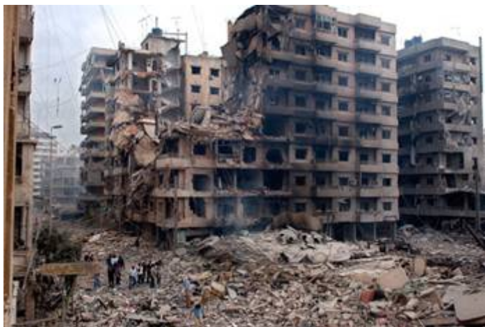
Beiroet in 1989 na de bombardementen en artillerievuur door Syrië

In 1976 liet hij Libanon bezetten , beroofde het land van zijn soevereiniteit, veranderde het land in een trainingskamp voor terroristen en richtte daar ongestraft bloedbaden aan onder de christenen. In 1989 bombardeerde hij Beiroet terug naar het stenen tijdperk. De hele wereld keek toe en deed niets omdat er geen Joden of Israël in betrokken waren.