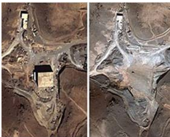
Door Israël platgebombardeerde reactor in Al Kibar, noord Syrië.

Na de locatie maandenlang te hebben geobserveerd, stuurde Israël er vervolgens een commando eenheid onder de codenaam Operation Orchard er op af. Deze commando's van de elite eenheid Sayeret Matkal, zagen zich in een werkelijk spectaculaire actie, kans onopgemerkt in de locatie door te dringen en nucleair materiaal buit te maken. Dit materiaal bleek na onderzoek afkomstig te zijn uit Noord Korea en bracht een samenwerking aan het licht tussen Syrië, Iran en de communistische Noord Koreaanse dictatuur. Volgens de CIA ging het om een plutonium reactor. De commando's, gekleed in Syrische uniformen, waren door helikopters gedropt en na hun gedane arbeid, weer opgehaald. Dat is allemaal gebeurd zonder door de door Rusland geplaatste radarsystemen met bijbehorende Pantsyr-S1 luchtafweerraketten, te zijn opgemerkt.