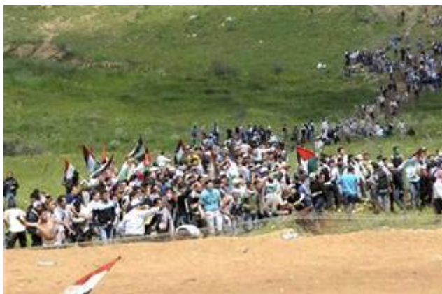
Georganiseerd door het terreurbewind in Damascus bestormen Boeren, burgers en buitenlui de Israëlische grens

Met georganiseerd vervoer werden op zondag 5 juni 2011 Syrische burgers en buitenlui (boeren) en enkele honderden Syriërs uit het Yarmouk vluchtelingenkamp naar de grens met Israël gereden om deze grens te bestormen maar dat verliep niet geheel naar wens . De grens kent een gedemilitariseerde zone waar een VN vredesmacht (UNDOF) van 1041 man de rust moet handhaven. De VN troepen zaten er met de neus bovenop maar staken zoals gewoonlijk geen vinger uit.