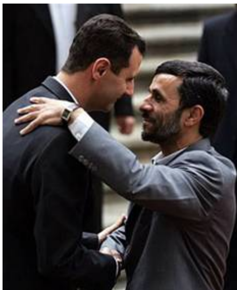
De Syrische leider Bashar al Assad met zijn grote vriend, de voormalige Iraanse leider Mahmoud Ahmadinejad

Israël met ballistische raketten te bestoken. De Israëlische minister van BZ Avigdor Lieberman zei “Wanneer er een oorlog mocht uitbreken, zal de Assad dynastie heel snel haar macht verliezen”.