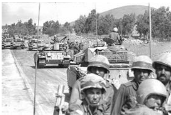
Israëlische troepen trekken richting Golan tijdens Yom Kippoeroorlog 1973.

Onder het bewind van de in het jaar 2000 gestorven dictator Hafez al-Assad is Syrië betrokken geweest bij elke oorlog tegen Israël. Onder Assads bewind is Syrië kort na de nederlaag in de Yom Kippoeroorlog in 1973 begonnen aan de wederopbouw van zijn leger daarbij geholpen door Rusland en anderen.