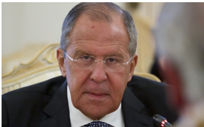
De Russische minister van Buitenlandse zaken Sergey Lavrov.

Rusland heeft het bewind van de Syrische dictator Bashar al Assad groen licht gegeven Israëlische vliegtuigen uit de lucht te schieten . De reactie kwam nadat Israël militaire posities van het Syrische bewind had aangevallen als reactie op projectielen die vanuit Syrië op Israëlische Golanhoogvlakte zijn terechtgekomen. De Russische minister van Buitenlandse zaken Sergey Lavrov riep Israël vervolgens op terughoudend te reageren en provocaties te vermijden. Al langere tijd worden er projectielen vanuit Syrië afgevuurd op Israëlische Golanhoogvlakte waarop Israël reageert met bombardementen op stellingen op Syrisch grondgebied. Op zaterdag 10 september viel er voor de derde keer binnen een week een vanuit Syrië afgeschoten mortiergranaat op Israëlisch grondgebied op de noordelijke Golanhoogvlakte. De Israëlische luchtmacht reageerde met aanvallen op kanonnen van het Syrische leger. Het Syrische leger schoot vervolgens twee raketten af in de richting van de Israëlische vliegtuigen maar de toestellen keerden zonder schade naar hun basis terug. Volgens de door de Staat gecontroleerde Syrische media zou het Syrische leger in de buurt van Quneitra een Israëlische straaljager en halverwege Damascus een drone hebben neergeschoten, die het luchtruim van het land hadden geschonden. Maar Israëlische militaire functionarissen zeiden dat alle vliegtuigen na de operatie veilig terugkeerden naar de basis, ondanks dat Syrische troepen op hen hadden geschoten.