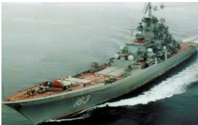
De Russische nucleaire raketkruiser Peter de Grote

Inmiddels is de Syrische havenstad Tartus één van de belangrijkste Russische buitenlandse marinebases geworden. De haven biedt plaats aan minstens 12 grote marineschepen, waaronder de enorme raketkruiser Peter de Grote. De haven doet dienst als het centrum voor Russische maritieme operaties in de Atlantische- en Indische Oceaan. De haven zal beveiligd worden met moderne S-300 en Iskander-E raketsystemen, een van Ruslands meest geavanceerde antiluchtdoelraketten. De 7.5 meter lange S-300 raket kan met een snelheid van tienduizend kilometer per uur vliegtuigen of vijandelijke raketten neerhalen die op een hoogte vliegen tussen zes en 27 kilometer. Dit wapensysteem, dat per batterij uit achttien raketten bestaat, kan verder tegelijkertijd twaalf raketten op twaalf verschillende vijandelijke vliegtuigen of vijandelijke raketten afvuren. Hoewel de Israëlische strijdkrachten inmiddels een anti-raketwapen tegen de S-300 luchtafweerraketten hebben ontwikkeld , wordt de Israëlische luchtsuperioriteit door de raketten wel degelijk in gevaar gebracht.