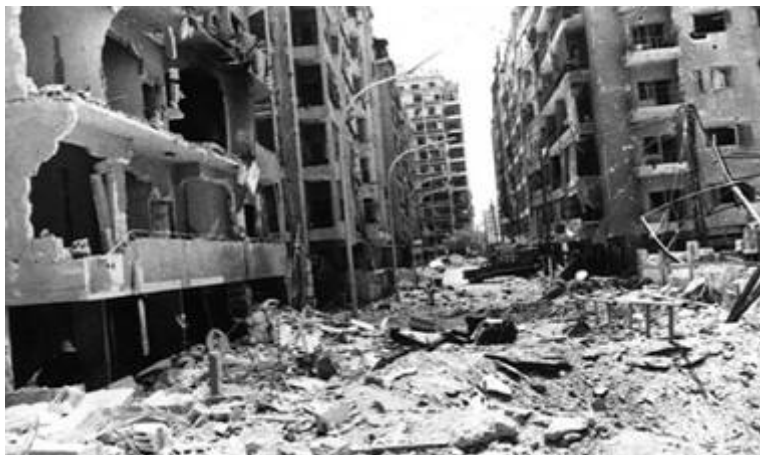
Het centrum van de Syrische stad Hama in 1982, verwoest door de Syriërs!

Roof, moord en onderdrukking waren de geliefde machtsmiddelen van dictator Hafez al-Assad. Tijdens de grote opstanden die in 1982 tegen zijn bewind uitbraken in de steden Hama, Homs, Aleppo en Latakia werden tussen de twintig en dertigduizend burgers vermoord. De pers mocht er vanzelfsprekend niet bij, toen Assad de burgers van die steden liet uitroeien.