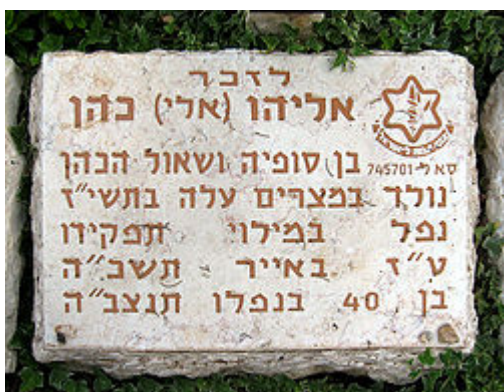
Monument voor Cohens nagedachtenis in Herzlberg in Jeruzalem

Na een proces werd hij in het openbaar op 18 mei 1965 in Damascus opgehangen . De executie werd in Syrië rechtstreeks op televisie uitgezonden. Hoewel er verschillende verzoeken zijn geweest, is zijn lichaam nooit teruggegeven aan zijn familie. Het werd begraven op de Joodse begraafplaats van Damascus. Klik hier voor de video: Eli Cohen: The Mossad's Master Spy.