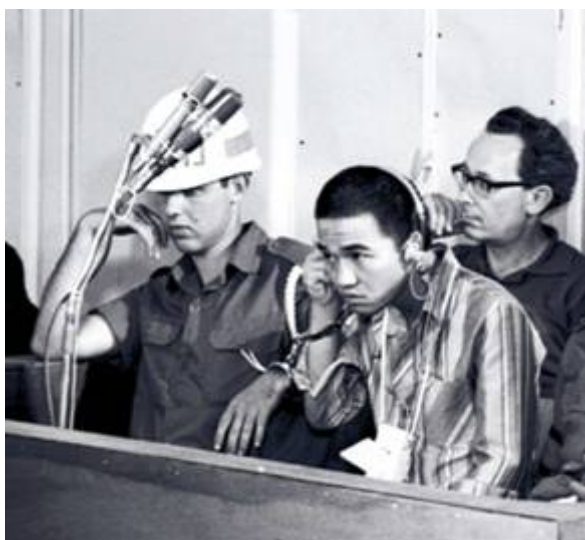
Okamoto tijdens zijn proces

De enige overlevende terrorist, Kozo Okamoto, werd neergeschoten door de beveiliging en gearresteerd toen hij probeerde de terminal te verlaten en werd later veroordeeld tot 3 keer levenslange gevangenisstraf plus nog eens tien jaar opsluiting.