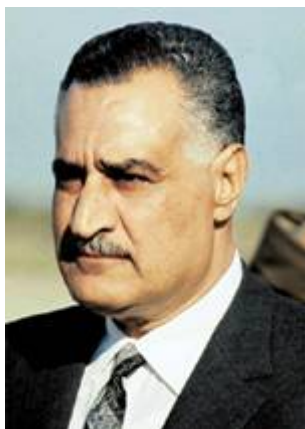
Gamal Abdul Nasser

Na de vernederende nederlaag in de oorlog van 1948 was het bepaald niet over met de vijandigheid van de verschillende Arabische landen. Zo stelde Gamal Abdul Nasser die in 1952 door een staatsgreep aan de macht kwam in Egypte, zich uiterst onverzoenlijk tegen Israël op.