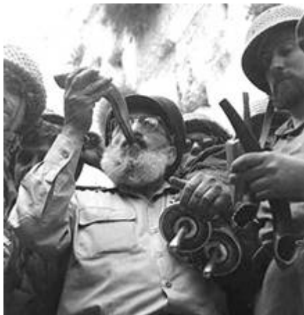
Shlomo Goren blaast de Sjofer

182 Israëliische soldaten verloren hun leven bij de bloedige slag om Jeruzalem. Vandaag kan iedereen de stad bezoeken, maakt niet uit welke religie, iedereen is welkom. Voor enkele beelden van de bevrijding van Jeruzalem klik hier .