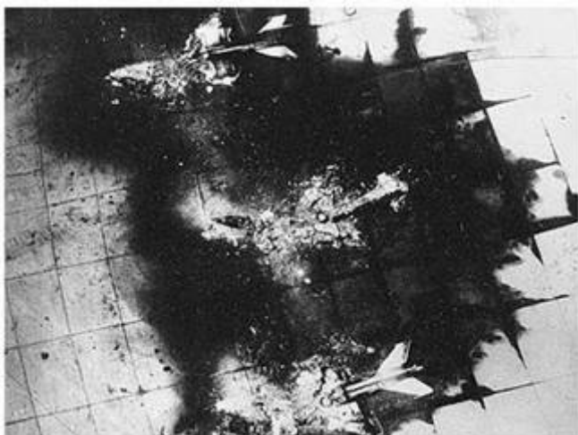
Vernietiging Egyptische vliegtuigen

Moshe Dayan was voorstander van een preventieve aanval vanwege de provocaties van de Arabische bureaus omdat een oorlog onafwendbaar leek. Een preventieve aanval zou de verliezen aan de Israëliëse kant enorm verkleinen. Om vernietiging te voorkomen besloot Israël daarom niet langer lijdzaam toe te zien en besloot om 7.45 in de ochtend van 5 juni met een verrassingsaanval op de Egyptische vliegvelden .