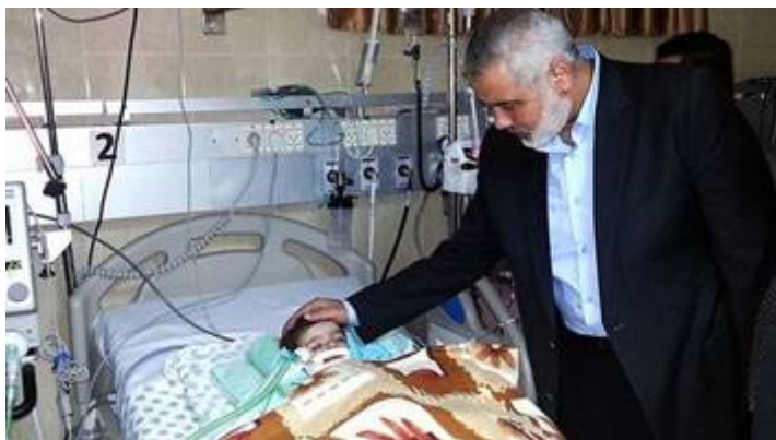
Haniyeh bij zijn kleindochter

Maar nu was hij Israël even nodig. De toestand van het een jaar oude meisje was door een acute infectie van haar spijsverteringskanaal zou verslechterd dat Haniyeh het meisje naar Israël stuurde waar zij in kritieke toestand is opgenomen. Zonder te aarzelen opende de Joodse Staat zijn armen om het kind te helpen. Zij werd onderzocht in het Schneider Kinderziekenhuis in Petach Tikwah maar de Israëliische artsen slaagden er helaas niet in om de oorzaken van de plotselinge vergiftiging van het meisje te achterhalen waarna het meisje in kritieke toestand naar Gaza is teruggekeerd. Berichten over de gebeurtenis zijn verwijderd van alle officiële websites van Hamas.