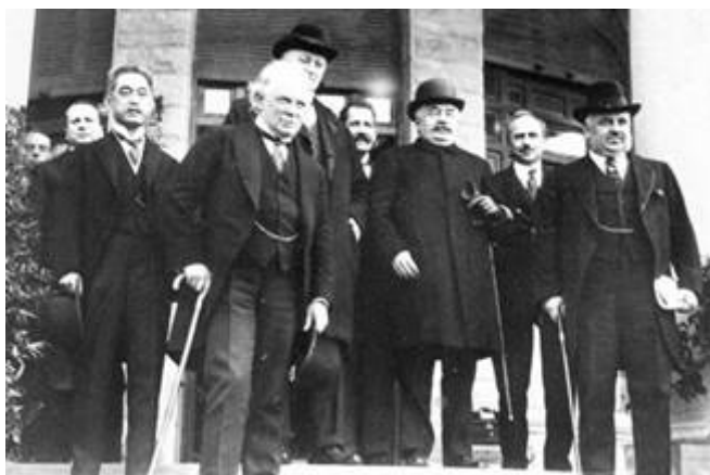
Deelnemers van de San Remo conferentie , 1920

Israëls recht op het land werd tijdens de San Remo conferentie gehouden van 19 tot 26 april 1920, vastgelegd in een aantal bindende documenten door de eerste-ministers van Frankrijk (Millerand), Groot Brittannië (Lloyd George) en Italië (Nitti) en Japanse, Griekse en Belgische afgevaardigden.