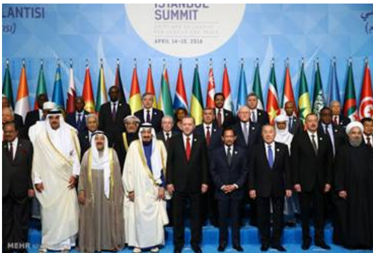
Hier een deel van de anti-Israël klik samen op de foto met de Turkse dictator Erdogan in het midden vooraan.

De Verenigde Naties wordt voor een deel beheerst door de vereniging van doodsvijanden van Israël de “Organisation of the Islamic Coöperation”(OIC) een machtsblok van 57 islamitische landen die zich voornamelijk bezig houdt met het indienen van resoluties die tegen Israël gericht zijn. Daarbij worden zij aan een meerderheid geholpen door de steun van andere dictaturen. Hele landen worden gekocht om Israël zwart te maken en hun stem tegen dit land te verheffen. In 1967 werd de OIC opgericht met als belangrijk doel om Israel in alle internationale organisaties zoals de VN altijd veroordeeld te krijgen. Turkije is de belangrijkste leider van deze club die de westerse mensenrechten minacht en die streeft naar invoering van de sharia, wereldwijd.