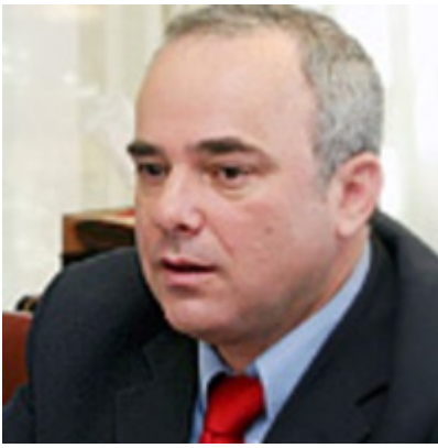
De Israëlische minister Yuval Steinitz

Ook was Obama van plan de soevereiniteit van de Tempelberg aan de moslims over te dragen en drong hij aan op de stationering van een internationale troepenmacht in de Bijbelsegebieden Samaria en Judea. Ook vond hij dat Israël de controle van Jeruzalem diende over te dragen aan een internationale organisatie.