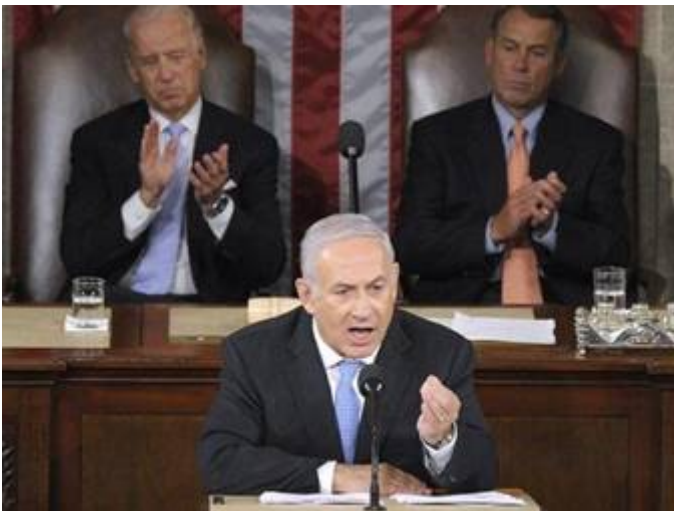
Netanyahu tijdens zijn toespraak voor het Amerikaanse Huis van Afgevaardigden en de Senaat.

Ook zei hij dat Jeruzalem nooit meer verdeeld zal worden en de verenigde hoofdstad van Israël zal blijven. Hij verklaarde dat de oorzaak van het voortdurende conflict lag in het feit dat de Palestijnen niet bereid waren een Joodse staat te accepteren. Zijn toespraak moet veel kwaad bloed hebben gezet bij de 'grote baas' in Washington.