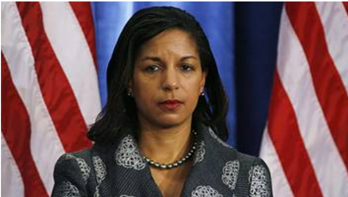
De Amerikaanse ambassadeur bij de VN, Susan Rice

Obama herhaalde met regelmaat zijn standpunt, dat de Joden niet mochten bouwen en wonen op hun oude Bijbelse grondgebied omwille van de vrede in de regio. Voor de VN-Veiligheidsraad verklaarde de Amerikaanse ambassadeur Susan Rice dat het Witte Huis „ de legitimiteit van Israëlische nederzettingen (sic) niet aanvaardt, en zich zal blijven verzetten tegen alle inspanningen om (Joodse) buitenposten te legaliseren. ” Rice stelde voorts „ dat de Joodse aanwezigheid in de Westbank schadelijk is voor het plan van de internationale gemeenschap om het conflict op te lossen door het oprichten van een Palestijns-Arabische Staat. ” Maar Israël kan niet worden beschouwd als een buitenlandse macht in Judea en Samaria, maar als de historische stichters van het gebied als een verenigde natie-staat. Joodse archeologische vondsten van duizenden jaren oud zijn daar de bewijzen van. Israël heeft het wettelijke recht om zich te vestigen in Judea en Samaria en de oprichting van nederzettingen kan op geen enkele wijze worden beschouwd als illegaal.