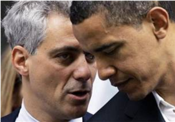
Rahm Emanuel en zijn voormalige baas Barack Hoessein Obama.

met de uitbreiding van nederzettingen te stoppen.