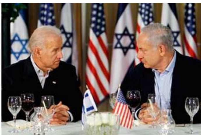
Vice president Biden in gesprek met Netanyahu tijdens zijn bezoek aan Israël.

Steeds opnieuw leidde Israël's aankondiging nieuwe woningen te willen bouwen in onder meer Jeruzalem tot felle afkeurende reacties van de Obama-administratie. Dat was ook het geval tijdens het bezoek van de Amerikaanse vice-president, de Jezuïet Joe Biden aan Israël om het in het slop geraakte ‘vredeproces’ nieuw leven in te blazen. Biden sprong bijna uit zijn vel van woede toen hij hoorde over Israël's bouwplannen en kwam onmiddellijk met een felle veroordeling door Israël te beschuldigen van het „ ondergraven van het nodige onderlinge vertrouwen ”. In dit geval ging het om Ramat Shlomo dat zich binnen de gemeentegrenzen van Jeruzalem bevindt en door Israël volkomen terecht wordt beschouwd als hun ongedeelde hoofdstad. Het gebied valt niet onder de ‘bevrozing’ van de nederzettingen waartoe de Israëlische regering van Benjamin Netanyahu in december 2009 besloot, om de vastgelopen vredesbesprekingen met het PLO-bewind vlot te trekken. De toenmalige burgemeester van Jeruzalem Nir Barkat, zei tegenover het Britse Sky News dat hij geen enkele door Amerika opgelegde bouwstop in Jeruzalem zou accepteren.