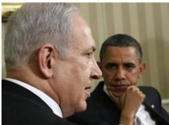
Obama is niet echt blij zo te zien

De lichaamstaal van de moslimbroederschap extremist Obama sprak boekdelen tijdens die conferentie. In VS werd die lichaamstaal na de persconferentie tot in detail geanalyseerd.