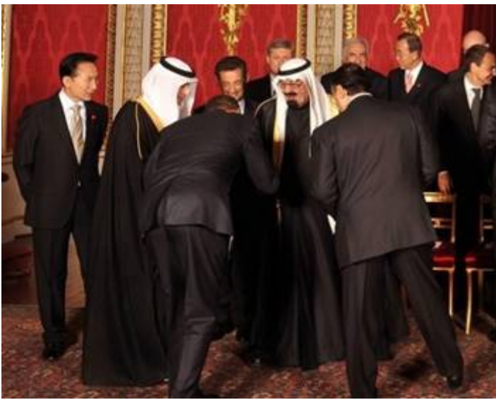
Hier buigt Obama voor de Saoedische dictator Abdullah

De gezaghebbende Amerikaanse krant de Wallstreet Journal vatte het buitenlandse beleid van Obama als volgt samen: „Onze vijanden worden het hof gemaakt, onze vrienden afgeperst. Het overkwam Polen, Tsjechië, Honduras en Colombia. Nu is Israël aan de beurt.”