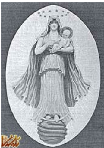
Maria en Jezus? Nee, dit is een afbeelding van Isis en Horus en gaat terug op de "Koningin des Hemels" Semiramis en Tammuz in Babylon. Let op de twaalf sterren; die zijn thans terug te zien in de vlag van Europa.

Jeremia 7:18 De kinderen rapen hout, de vaders steken vuur aan en de vrouwen kneden deeg om offerkoeken te maken voor de koningin des hemels en zij brengen plengoffers aan andere goden teneinde Mij te krenken.