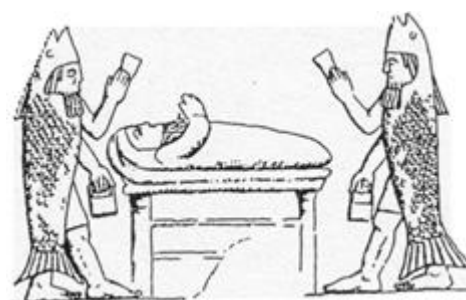
Oannes op een Assyrische