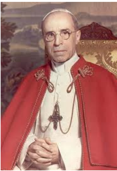
Paus Pius XII

Ook de heilig verklaring in de RK-kerk is iets wat de Bijbel niet kent. Heiligheid kan de mens alleen verkrijgen door de genade van God. Heiligen zijn verlost kinderen, afgezonderd van de wereld en van hun zonden. Zij zijn rechtvaardig verklaard alsof ze nooit gezondigd hebben. Zij zijn in Christus, ook de allerzwaksten. Iemand die niet verder is gekomen dan wat gemompel tot de Here en gevraagd heeft om in zijn hart te komen, die is door de Here aangenomen en een heilige geworden. Dat is een puur persoonlijke zaak, daarvoor heeft de mens niemand nodig en zeker de kerk van Rome niet. Dat is een zaak tussen de mens en God zonder tussenkomst van derden. Maar voor een rooms-katholiek is niet Gods Woord het hoogste gezag maar is de mening van de kerk beslissend.