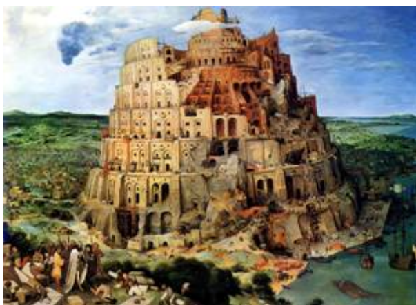
De Toren van Babel, Pieter Bruegel 1563

Genesis 11:4 Welaan, laten wij ons een stad bouwen met een toren, waarvan de top tot de hemel reikt, en laten wij ons een naam maken, opdat wij niet over de gehele aarde verstrooid worden.