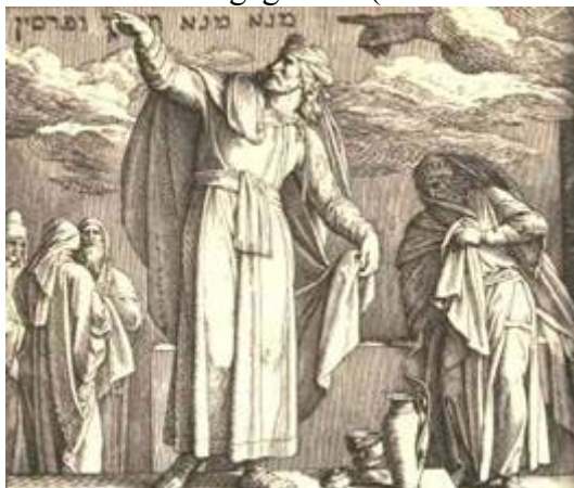
Mene mene tekel ufarsin

Nimrod was niet alleen de stichter en politieke leider van Babylon, maar ook haar religieuze leider. Hij was de priesterkoning van deze stad. Van hem stamt een hele dynastie van priesterkoningen af - ieder steeds het hoofd van de Babylonische mysteriegodsdiens. Deze dynastie duurde voort tot in de dagen van Belsazar, waarover de profeet Daniël bericht. Belsazar is bekend van de geheimzinnige hand die woorden van onheil schreef op de wand van het paleis van de koning. Daniël verteld Belsazar dat God zijn koningschap geteld heeft en er een eind aan maakt; "gij zijt in de weegschaal gewogen en te licht bevonden: uw koninkrijk is gebroken en aan de Meden en Perzen gegeven." (Daniël 5:25-26-27-28)