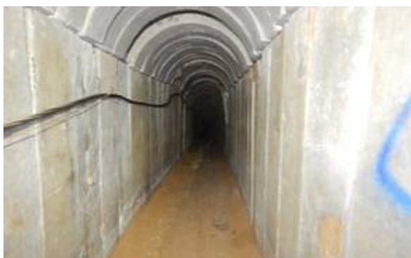
Een onderdeel van Hamas' kilometers lange Metro netwerk”

Wat de geschiedenis in zal gaan als een briljante militaire operatie van het Israëlische leger, vond plaats tijdens een aanval van 40 minuten op het tunnelnetwerk de “Metro van Hamas” in Gaza waarbij Israël kilometers aan tunnelnetwerken vernietigde.