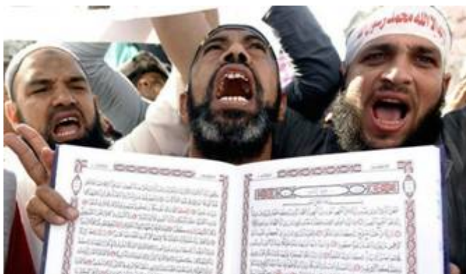
Volgelingen van de 'vredelievende religie.'

Er raast opnieuw een storm van nazi-antisemitisme/Jodenhaat over de wereld. Wereldwijd vallen er jaarlijks bij terreuraanslagen van islamitische extremisten duizenden doden , maar daar richt de aandacht zich niet op. De vuile vingerafdrukken van Hitlers moordmachine zijn weer helemaal terug op het wereldtoneel en richt zich op Israël. Wat wij vandaag zien is het voortzetten van de Nazi ideologie van vroeger. Er bestaat een kolkende rivier van haat tegenover elke menslievende poging van Israël om in vrede te leven met haar burens en tegenstanders. De Jood wordt weer als een uniek kwaadaardig schepsel neergezet en de staat Israël als een "koloniale, racistische en moorddadige entiteit" die niets liever doet dan Palestijnse kinderen vermoorden wanneer wij dag na dag de diverse berichten in de media moeten geloven. Honderdduizenden gingen de straat op om te demonstreren tegen Israëls 'brutaliteit' haar eigen bevolking te beschermen tegen een Moloch doodscultuur in Gaza die uit is op haar vernietiging.