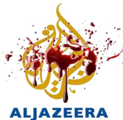
Afbeelding Gellerreport 30 mei 2020.

Qatar staat bekend als één van de grootste sponsoren van het hedendaagse moslimterrorisme. Onder de huidige leider emir Tamim bin Hamad al-Thani heeft Qatar zich ontwikkeld tot een gevaarlijke vijand van Israël en één van de belangrijkste sponsoren van diverse moordende islamitische terreurgroepen waaronder de terreurbeweging Hamas de demonen van ISIS , Al Qaeda, Boko Haram en terreurgroepen in Libië. Na de oorlog van 2014 doneerde Qatar op de Donor Conferentie voor Gaza van 12 oktober 2014 in Cairo, maar liefst 1 miljard dollar voor de reconstructie van de Gazastreek.