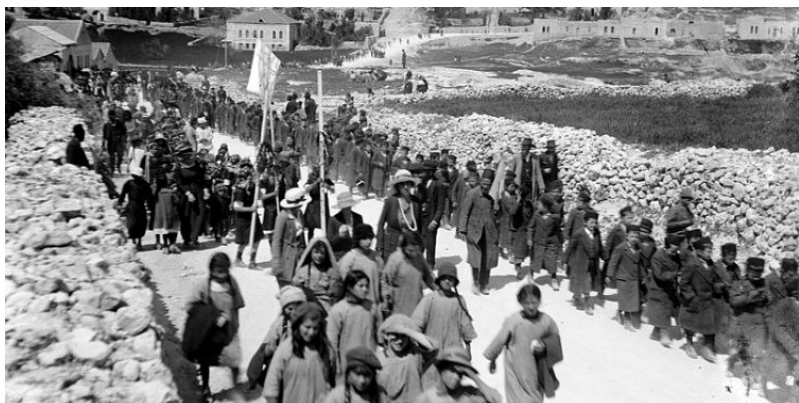
Joden bezoeken in 1918 het graf van Simon Hatzadik ('Simon de rechtvaardige'). De grond bij het graf werd in 1875 door Joden gekocht en er verrees een Joodse buurt.

Dat het gaat om rechtszaak in een andere land toont nog meer disrespect voor de democratische grondbeginselen. Al helemaal omdat het Israëlietische Hoogerechtshof een uitstekende reputatie heeft. Rutte roept hiermee op om Joden te discrimineren bij het uitoefenen van hun (eigendoms-) rechten. Het geheel komt neer op zowel het schofferen van een bevriende natie als een klap in het gezicht van de Joden in Nederland. Als Rutte zo graag wil dat de Palestijnse wanbetalers er blijven wonen, laat Nederland dan hun huur betalen. Sigrid Kaag (D66) bijvoorbeeld wil dat vast met plezier doen. Maar misschien kan de bemoelial Rutte zich beter op de grote problemen in ons eigen land focussen, in plaats van zich te mengen in het rechtssysteem van een ander land. Maar goed, Rutte zal wanneer ze hem daarover aanspreken er waarschijnlijk 'geen herinnering' meer aan hebben of zoals hij dat tegenwoordig formuleert 'een verkeerde herinnering'.