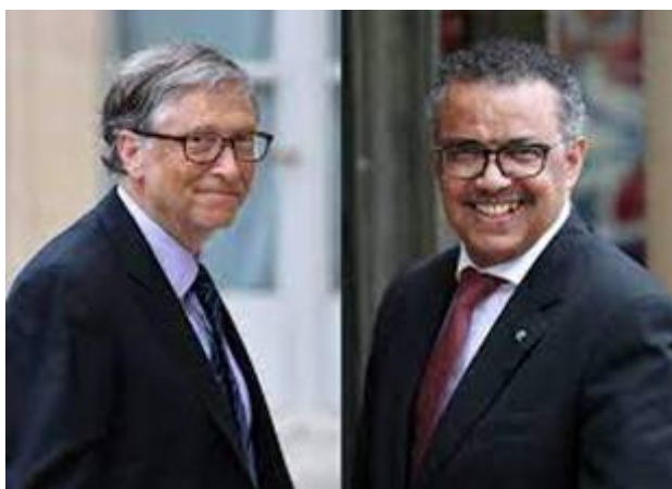
Bill Gates en Tedros Adhanom Ghebreyesus de grote baas van de WHO