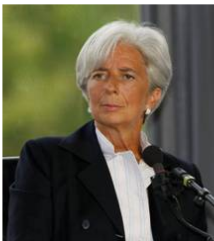
Christine Lagarde, trekpop van de Bilderberg klik

De uitrol hiervan is onontkoombaar. De door Kuipers aangekondigde investering van 20.4 miljoen voor een corona-app die dit jaar doorgevoerd moet worden terwijl het narratief van een dodelijke ziekte allang is achterhaalt, maakt duidelijk dat de QR-code niet meer verdwijnt. Het regeringsbeleid rondom het digitale paspoort is gebouwd door de WEF-sekte van Klaus Schwab. Hele strofes zijn letterlijk overgenomen uit WEF-documenten en daarmee is de invloed van WEF-sekte niet meer te ontkennen. Het wordt erger dan het was. De digitale identiteit gaat gepaard met de introductie van een Europese digitale munt. Voor het afschaffen van cash geld heeft de klik in Brussel Christine Lagarde op 1 november 2019 aangesteld als voorzitter van de Europese Centrale Bank. Dat zij deze baan heeft gekregen heeft alles te maken met haar aanwezigheid op de Bilderberg vergaderingen van 2013 en 2016 . Het was zoals gebruikelijk, al van te voren bekend dat Lagarde deze functie zou krijgen.