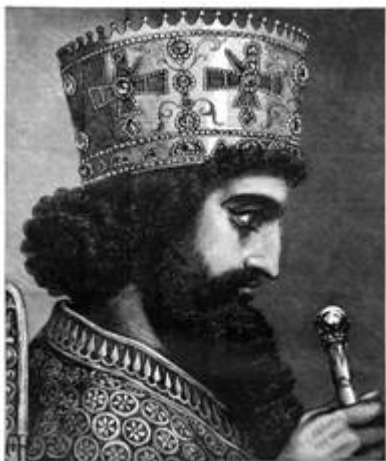
Xerxes (Koning Ahasveros)

Op 17 maart (het begon s'avonds 16 maart en eindigde s'avonds 17 maart) vierde het Joodse volk weer het Poerimfeest (Hebreeuws: פּוּרִים), en werd de bevrijding herdacht dat het in de vijfde eeuw v. Chr. in ballingschap leefde in het rijk van de Meden en Perzen (het Perzische Rijk). Poerim valt een maand voor Pesach. Een andere naam voor Poerim is Lotenfeest. Die naam verwijst naar de nieuwe loten die in de lente aan bomen en struiken ontspruiten. Het wordt gevierd op 14 e adar op de Joodse kalender en valt daarmee in het vroege voorjaar. De Joodse kalender is een 'maankalender' en Poerim valt daardoor elk jaar op een andere dag. In 2023 is het op 7 maart. Het feest herinnert aan de dreigende ondergang van het Joodse volk. Het Poerimfeest verwijst naar de geschiedenis van Mordechai en Esther wat beschreven wordt in het boek Esther. Door haar schoonheid was het Joodse meisje Esther (haar Hebreeuwse naam is Hadassa) aan het hof van koning Ahasveros ( Xerxes ) terecht gekomen. Ahasveros regeerde van India (het huidige Pakistan) tot aan Cusj (het huidige Ethiopië) aan toe. De troon van de koning stond in Susaan, in het westen van Perzië. Deze stad heet nu Shush en ligt in het zuidwesten van het huidige Iran.