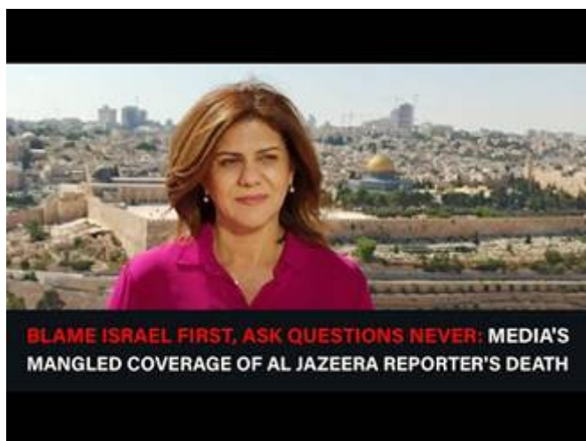
Al-Jazeera senior reporter Shireen Abu Akleh

De “Bende van Ramallah” onder leiding van de Palestijnse president (die al sinds 2009 geen president meer is) Mahmoud Abbas verwerpt daarom elk aanbod voor een objectief onderzoek. Hij spreekt van een bewuste door Israëlische militairen gepleegde “executie” waarvoor tot dusver nog geen enkel bewijs bestaat . Zij en hun schoothondjes in de fakestream media voeren- zoals wij dat van hen gewend zijn- weer het bekende bloedsprookje op door Israël bij voorbaat als dader aan te wijzen.