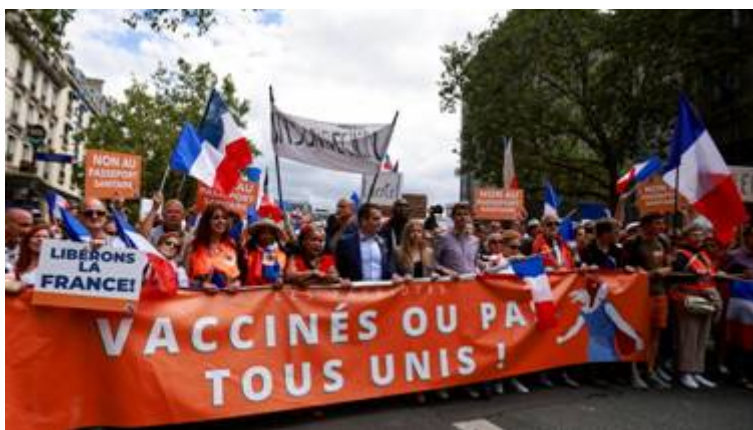
Demonstraties tegen het bewind van dictator Macron in talloze Franse steden.

Er wordt heel bewust angst gezaaid om mensen ervan te doordringen dat het nodig is zich te laten injecteren. Wat de wereld momenteel meemaakt is massale krankzinnigheid. Zo wil de Duitse regering dat ongevaccineerden ' nergens meer naar binnen mogen '. Volgens de Duitse krant Bild staat dat in de coronaplannen van Berlijn voor de herfst en winter. Het dagblad spreekt over snoeiharde maatregelen. Bild meldt dat in Duitsland binnenkort een vaccinatieplicht geldt voor alle gebouwen. In Frankrijk is door het regime van dictator Macron de 'vaccinatiewet' ingevoerd. Vanaf 9 augustus mag iemand alleen nog een Frans café of restaurant in met een vaccinatie-of testbewijs. Ook de toegang tot ziekenhuizen kan aan banden worden gelegd voor niet-gevaccineerden als het gaat om 'bezoekers en niet urgente patiënten'. Artsen en verplegers mogen naar eigen inzicht beoordelen wie wel en niet worden behandeld. Zorgpersoneel in Frankrijk mag verplicht worden zich te vaccineren. Zorgpersoneel in loondienst dat zich niet laat inenten, mag worden geschorst en het salaris mag worden ingehouden. Ondanks de massale demonstraties in honderden Franse steden, zegt Macron niet te zullen buigen.