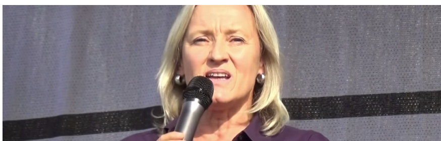
Foto: Beate Bahner (QUERDENKEN 711 - Wir für das Grundgesetz CC BY 3.0 )

Als 100 per 100.000 inwoners positief testen, zijn 99.900 mensen niet besmet. En ook van die 100 mensen die positief getest zijn, is 99 procent gezond. Bahner noemt de PCR-test “ het grootste bedrog uit de geschiedenis van de geneeskunde en kan geen coronabesmetting aantonen. ” Klik ook hier voor mijn artikel over de PCR-test. Het is volgens Bahner volstrekt zinloos om je meerdere keren per week te laten testen op corona. “ Je gaat toch ook niet regelmatig naar het kerkhof om te kijken of je gestorven bent zonder dat je het in de gaten had? Je gaat toch ook niet drie keer per week naar de radioloog om te kijken of je een been hebt gebroken zonder dat je het merkte? ”