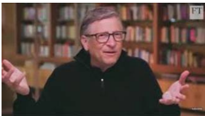
Bill Gates: You dont have a choice.

Dat klinkt natuurlijk krankzinnig en het is inderdaad krankzinnig. Het coronavirus is een Trojaans paard dat gebruikt wordt om een tirannieke agenda uit te rollen. Er wordt een spirituele en psychologische oorlog gevoerd tegen de mensen. Dit is waar het al die tijd om begonnen was. Dit is wat ze nodig hebben om ons tot slaaf te kunnen maken. Bill Gates zegt dat alle 7 miljard mensen op de wereld twee keer per jaar gevaccineerd moeten worden. 'U heeft géén keus. Mensen doen alsof ze een keus hebben.